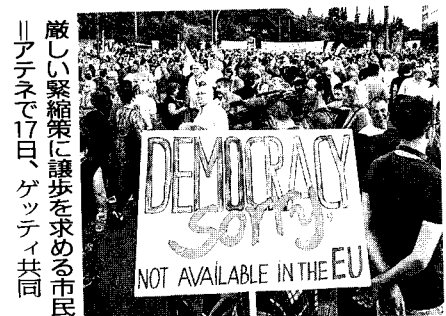
厳しい緊縮策に譲歩を求める市民。アテネで17日

迎えてみれば、この婿殿の行動には、やっぱり少々問題があった。むろん、大量殺りくなどに及んだわけではない。だが、総じて裕福な一族に受け入れられたので、気良くし、借金を重ねた。派手な生活に明け暮れた。どこまで、この放蕩婿さんの尻拭いを続けるか。一体、どの辺で見切りをつけるのか。思い切って見捨てるのか。