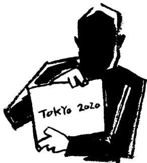
題字・絵 五十嵐晃